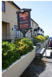
Ocean Lodge, kleines, freundliches Hotel in Killadoon, 9 km von Louisburgh, ruhig und direkt am Meer gelegen, Taxi und Minibusservice nach Louisburgh