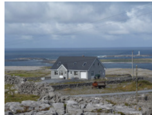
Ferienhaus, 5 Min. vom Zentrum, modernes, luxuriöses Haus mit spektakulärer Meersicht, 4 Zimmer, teils mit Dusche/WC