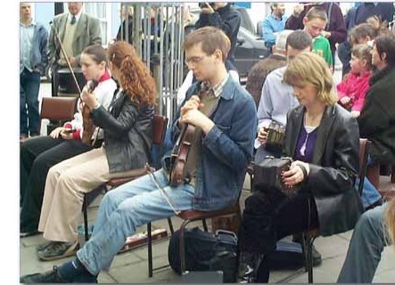
„Session“ im Freien am Féile Chois Cuain