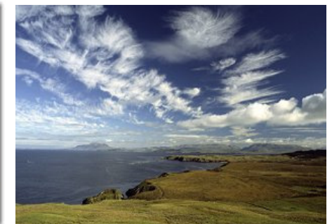
Umgebung von Louisburgh

Sechs Tage Kulturprogramm auf Inis Mór mit viel Zeit für eigene Unternehmungen, anschliessend Besuch des „Féile Chois Cuain“, einem tollen Festival in Louisburgh mit viel Musik, Gesang, Tanz und Workshops, Wandern in der wunderschönen Umgebung von Louisburgh, Co. Mayo, einem hübschen Städtchen umgeben von Bergen und unendlichen Stränden.