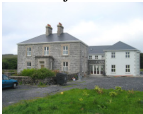
Kilmurveyhouse: kleines, komfortables ***Gasthaus mit freundlicher Landlady und gutem Essen