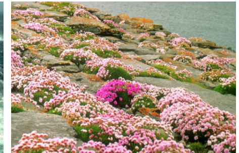
Maiblüte auf Inis Mór