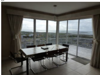
180 Grad Meersicht vom Wohnraum im Ferienhaus