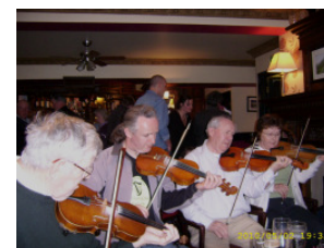
Session im Pub