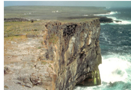
Klippen auf Inis Mór