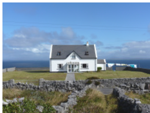
Elizabeth's Haus: gemütliche, persönliche Atmosphäre, schöne Meersicht, 2 Zimmer